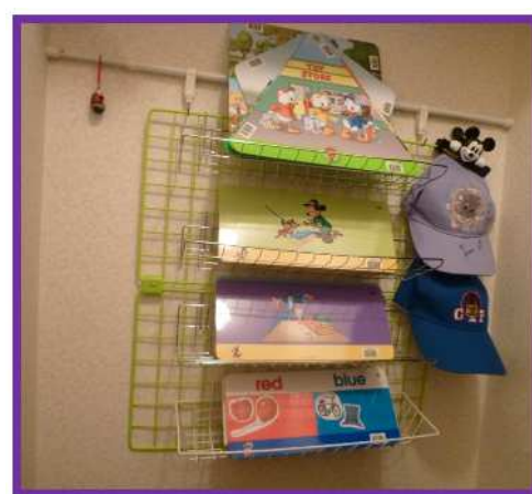
写真左: Fun Phone English の用紙、『英会話たいそう』のカード、Pre Graduation1の全文、カレンダー 写真中央: 上段に娘用の TAC、2 段目に息子用の TAC、My Book、キャラクターカード、ABC カード、録音用 ZAP 写真右: Q&A のカード、娘用の TAC のストーリー・カード、息子用の TAC、CAP